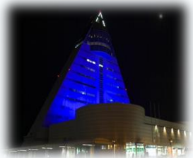
青森県観光物産館アスパム